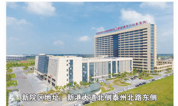
新院区地址: 新港大道北侧泰州北路东侧

灌南县第一人民医院 2023年11月28(内部发行) 连云港市第一人民医院灌南院区 第十一期(总第84期)